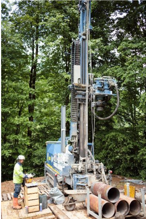
Probebohrung in Schwarzenberg